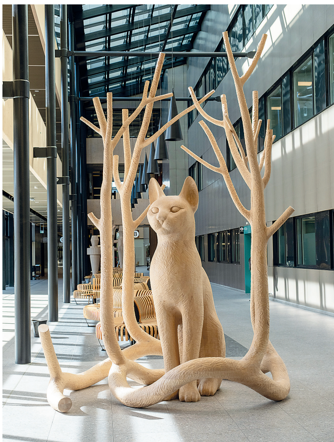
Sykehusbyggene er bundet sammen av en over 300 meter lang glassgate.