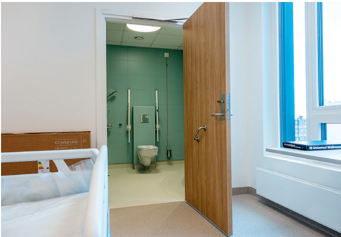
De fleste pasientrommene er enerom med eget bad.