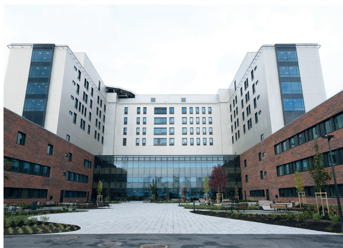
Drammen sykehus på Brakerøya åpnet dørene for pasienter og ansatte 5. oktober.