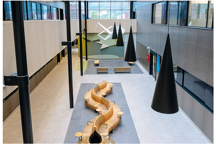
Planløsningen skal legge til rette for best mulig samhandling og logistikk.