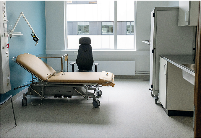
Bygget er nå i full drift, med moderne behandlingsfasiliteter.