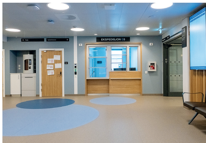
Det er brukt et fargekonsept med fire temaer, som er jord og landbruk, sjø og skog.