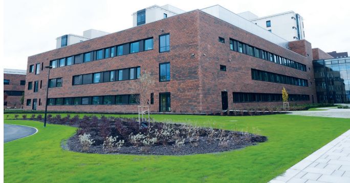
Sentralbygget er i ni etasjer.