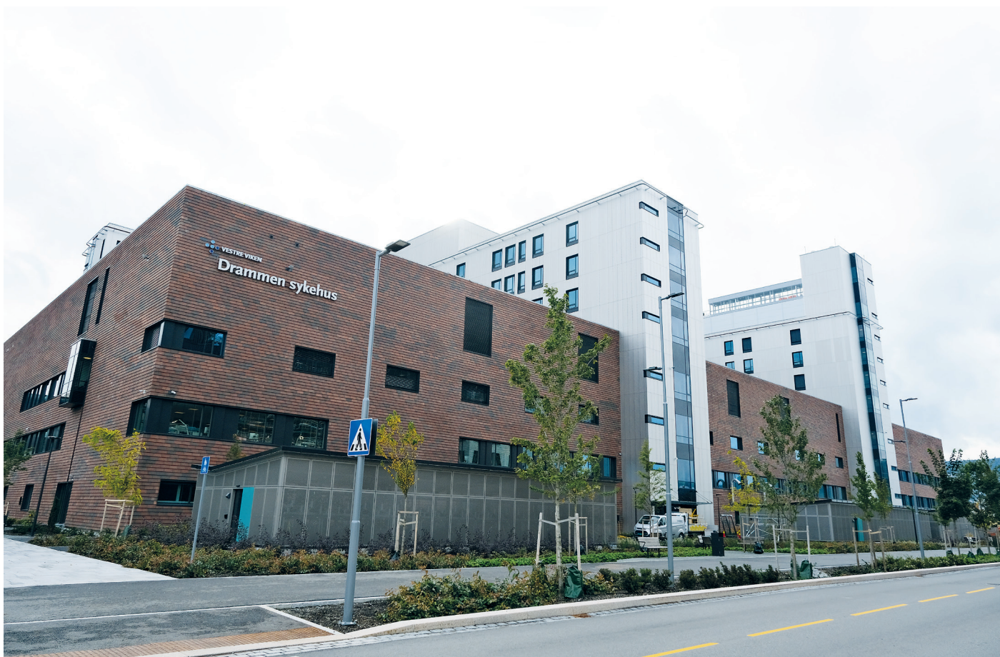
Det er et beplantet uteområde på 40.000 kvadratmeter.